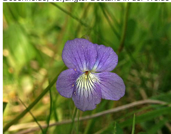
Hunds-Veilchen, eines der vielen Profiteure