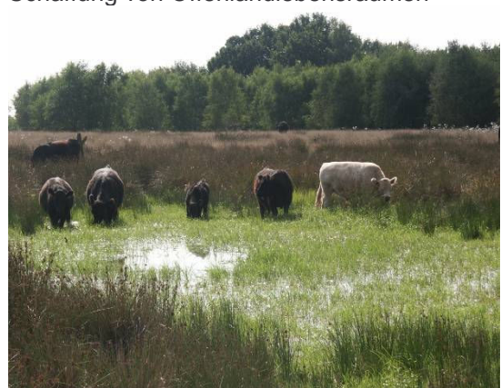
Pflegebeweidung aller Lebensräume