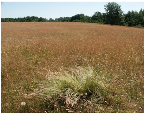
Borstgras, Ausbreitung in den Grasfluren

Nachfolgend werden ausgewählte Arten des Gebiets aufgeführt, die einen hohen Schutzstatus (FFH, VSchRL, RL) besitzen und/oder als Leitarten der halboffenen Weidelandschaft gelten.