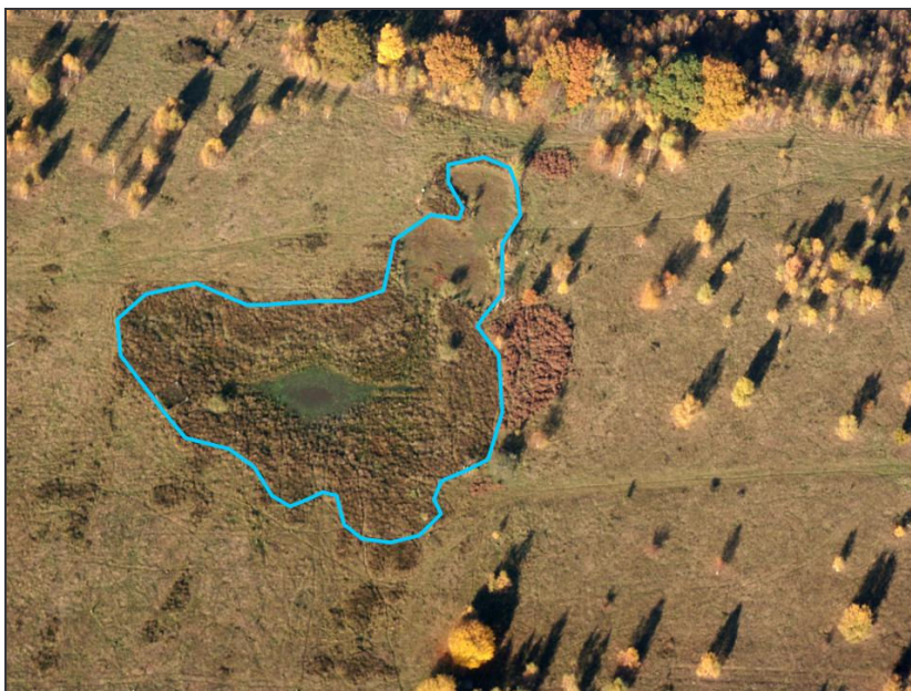
Abb. 5: Kammmolchgebiet Höltigbaum 2005: Stark verlandende Gewässersenke, ehemaliges Hauptreproduktionsgewässer des Kammmolchs und anderer Amphibien. Entschlammung erforderlich (vgl. Maßnahme 1/1)