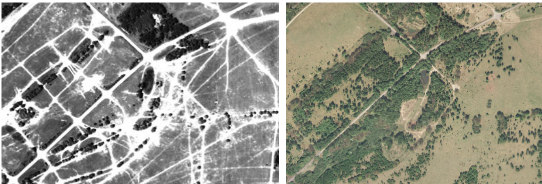
Abb. 2: Kammmolchgebiet Höltigbaum: Detail Luftbild – Vergleich: 1983 (links) / 2010 (rechts)

Genauere Daten über die Nutzungsgeschichte lassen sich erst für die letzten ca. 250 Jahre aus historischen Karten ableiten. Demnach befanden sich im 18. Jahrhundert überwiegend Heiden, die in Laufe des 19. Jahrhunderts zunehmend in die ackerbauliche Nutzung übergingen. Die militärische Nutzung des Gebiets als Standortübungsplatz begann 1937 und endete im Jahr 1992. Durch den intensiven Fahrbetrieb mit Panzerfahrzeugen und die Anlage von Gefechtshügeln wurde der Boden stark überprägt.