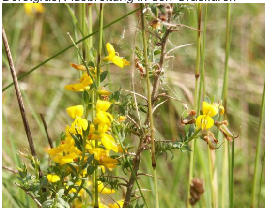
Engl. Ginster, bedornes „Weideunkraut“