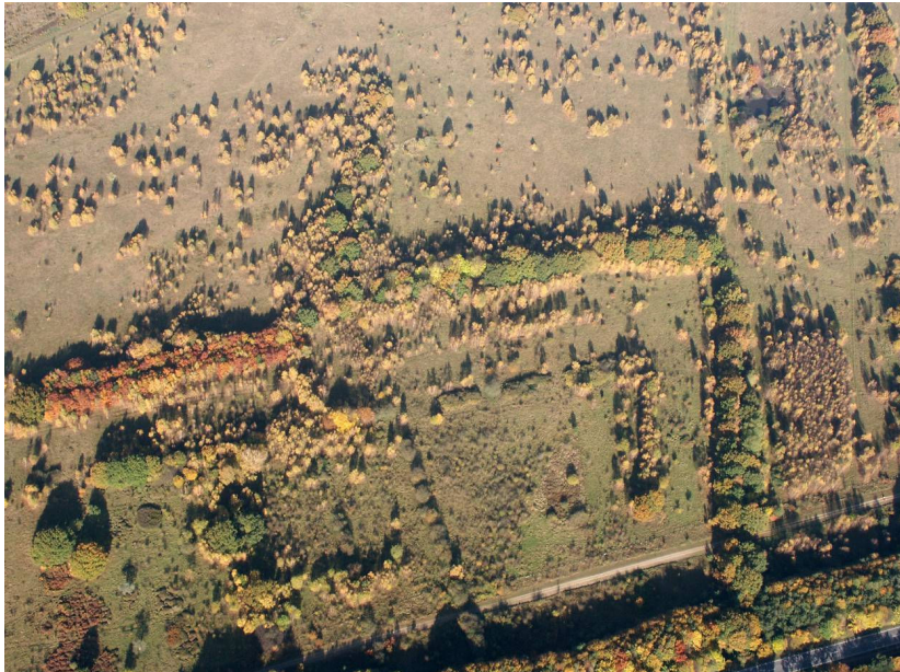
Abb. 4: Kammmolchgebiet Höltigbaum 2005: Starke Ausbreitung von Gehölzen im ehem. Offenland (vgl. Maßnahme 3/2)

Der südliche und östliche Rand des Gebiets wird von einem gepflanzten Gehölzsaum gebildet, bestehend aus zahlreichen, teils standortfremden Arten. Dieser Saum bildet einen wertvollen Habitatkomplex, gemeinsam mit dem angrenzenden breiten Wander- und Reitweg. Darüber hinaus besitzt er eine Abschirmfunktion gegen die angrenzenden Straßen. Er bedarf teilweise eines Umbaus, zum einen zu erhöhter Naturnähe sowie auch aus Gründen der Verkehrssicherung.