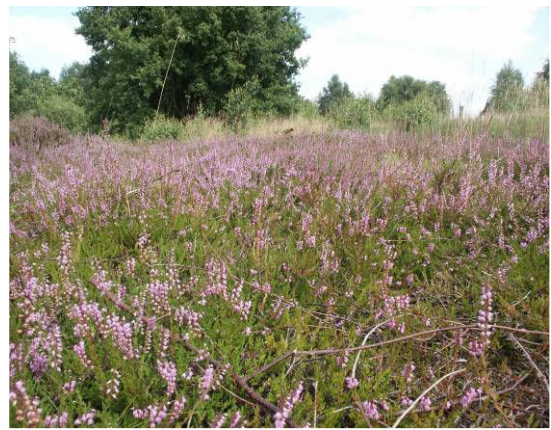
Besenheide, verjüngter Bestand in der Weide