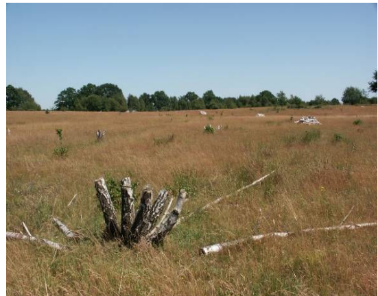
Schaffung von Offenlandlebensräumen